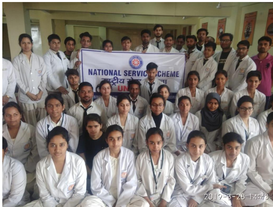
A Yoga Workshop was conducted in our college on 28 th March 2019 for NSS volunteers