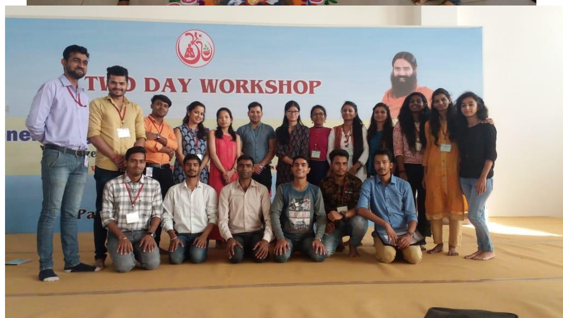
BNYS Students attended two days workshop on “Generating positivity : A Scientific Approach” organised by Patanjali research foundation and university of patanjali , Haridwar