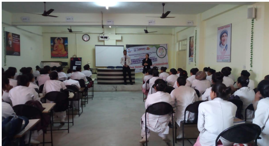
Nursing Department: A talk on Naturopathy and Yoga