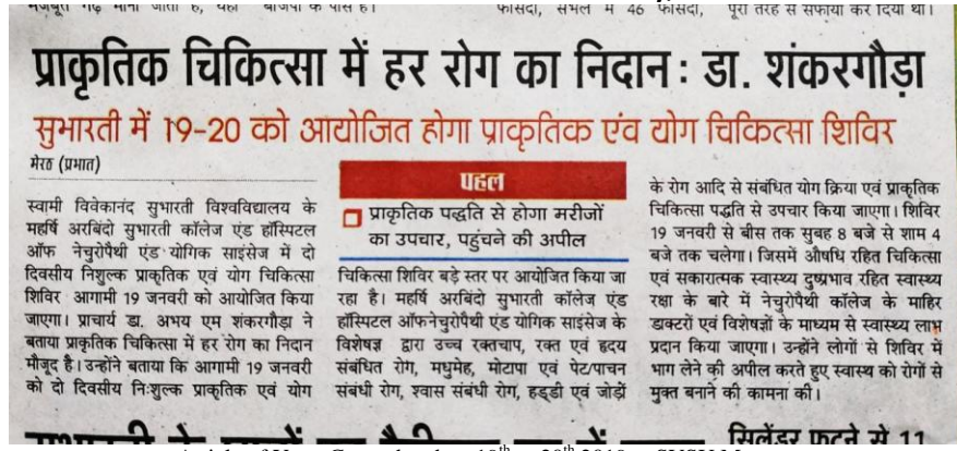
Article of Yoga Camp dated on 19 th to 20 th 2019 at SVSU Meerut.