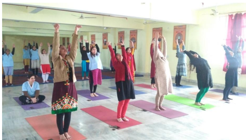
Our College conducted Yoga Workshop for Faculty & PG students of Subharti Dental College