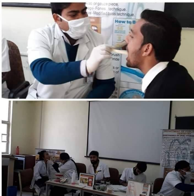
Oral health check up Camp was organized by Subharti Dental College, Meerut