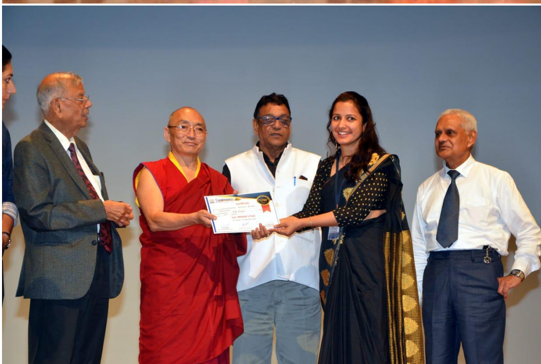
“Uni –Mentor Fest”