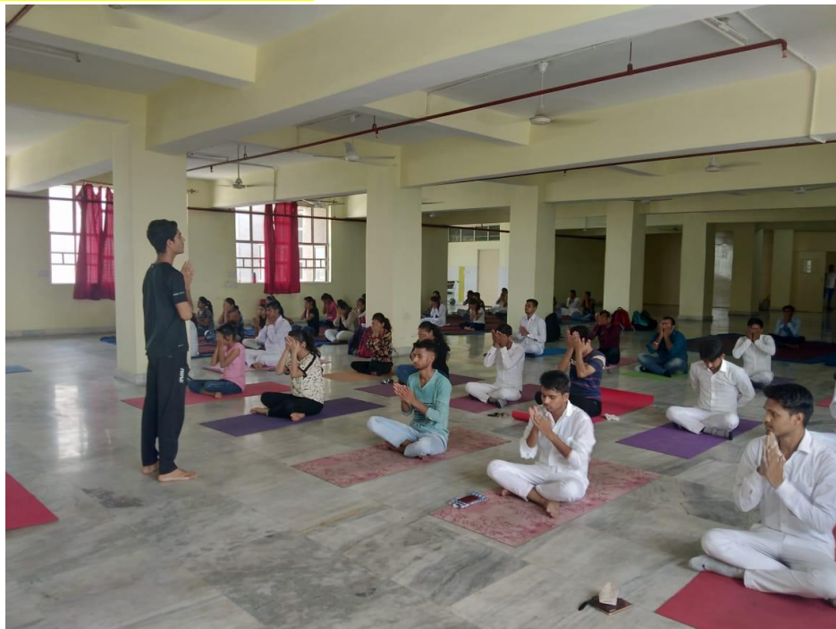
Two days Yoga Workshop in Orientation programme in Subharti College of Physiotherapy