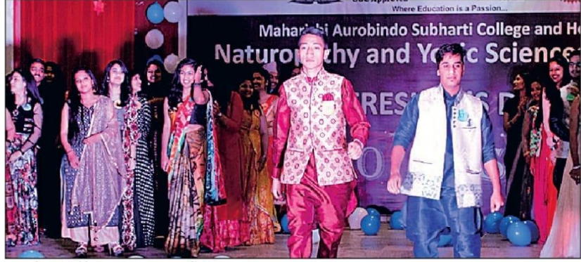
सुभारती यूनिवर्सिटी में आयोजित फ्रेशर पार्टी में हिस्सा लेते छात्र-छात्राएं।