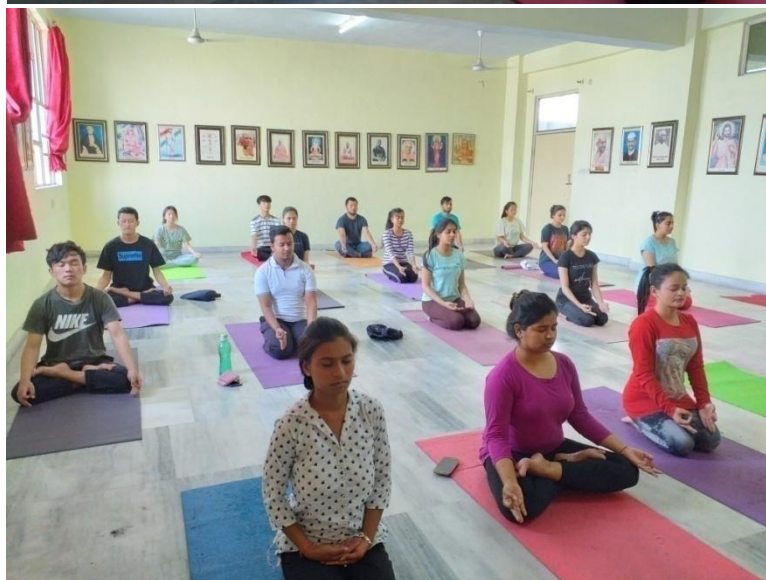
Our college conducted a yoga workshop (IDY) in yoga hall