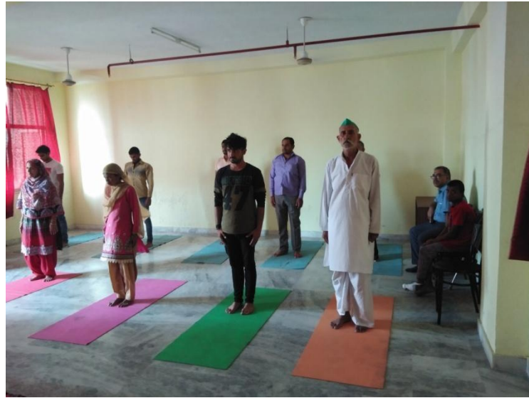
Yoga Workshop Regarding “A Yoga & Mental health” in Psychiatry Department at Subharti University Meerut