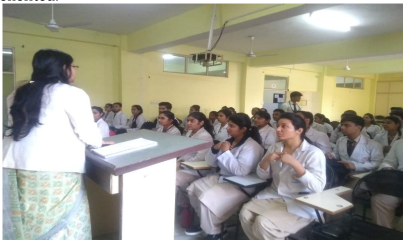
Physiotherapy Department: A lecture on Lifestyle Modification