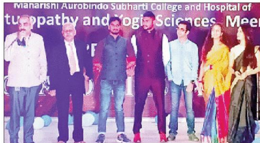
फ्रेशर पार्टी में विचार व्यक्त करते अतिथि।