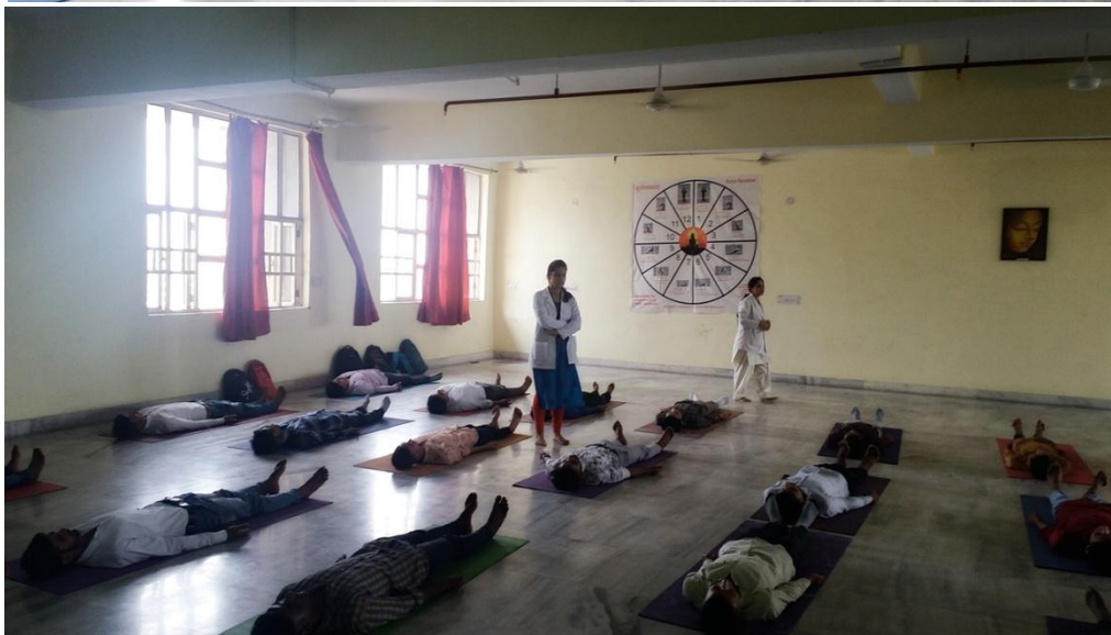
One day Yoga Workshop & lecture on “Role of Meditation in Behavioural and Physical Relaxation in Kharvel Subharti College of Pharmacy