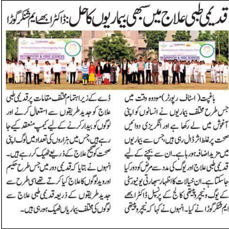
Article of Naturopathy day dated on 18 th November 2018 at Subharti University Meerut.