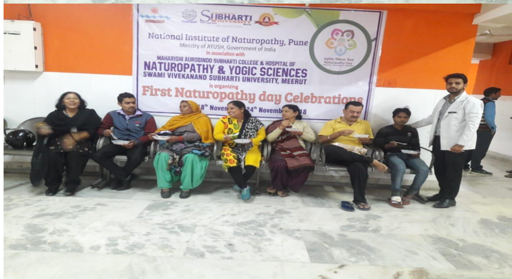
Free Naturopathy Camp: In MASCHNYS OPD free naturopathy Camp