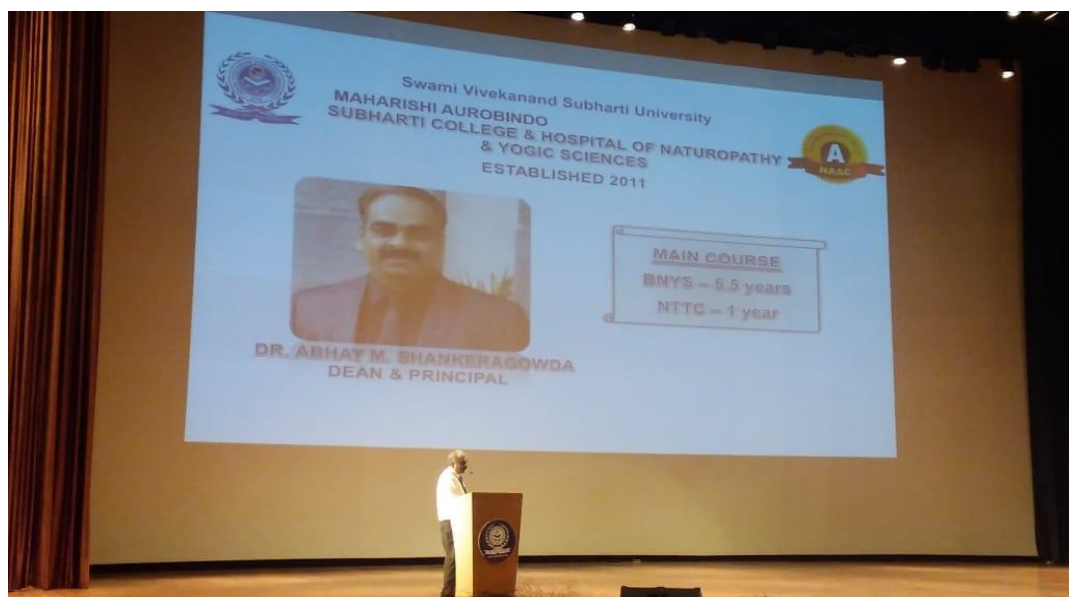
Subharti Orientation programme was conducted by the university