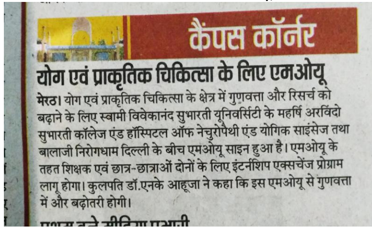
Article of A MoU was signed between Balaji Nirogdham, Bakhtawarpur a unit of Maharaja Agrasen Naturopathy & yoga Sadhana Research trust in Delhi and Swami Vivekanand Subharti University, Meerut on 05 th January 2019