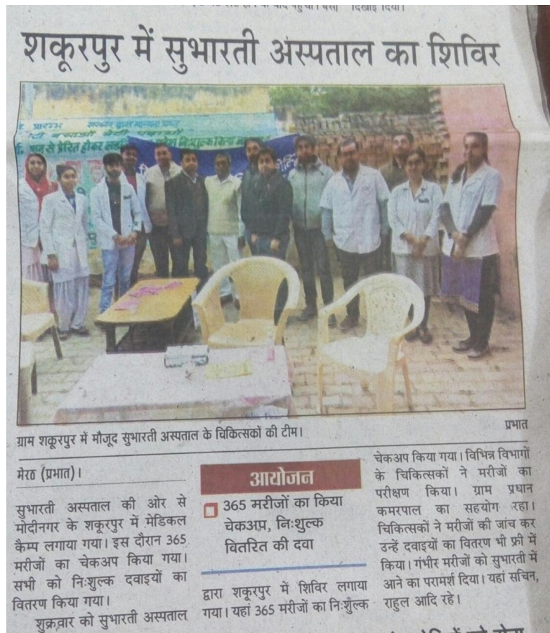
Article of Medical Camp in Shakurpur Modinagar.