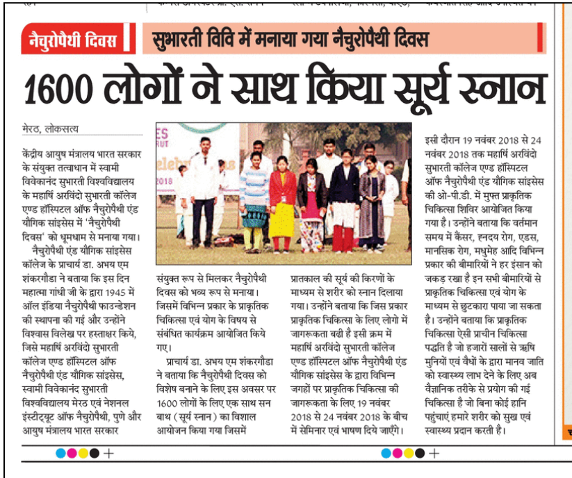
Article of Naturopathy day dated on 18 th November 2018 at Subharti University Meerut.