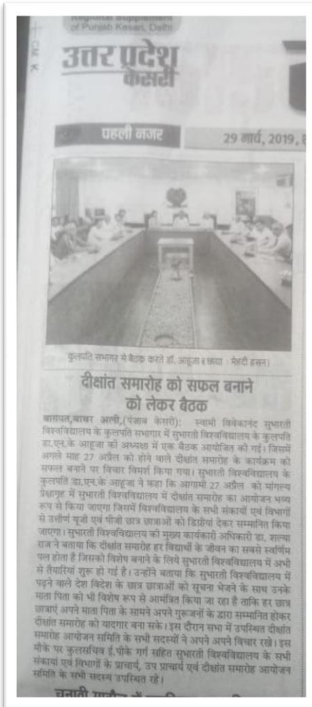
Article Meeting regarding Convocation at SVSU Meerut