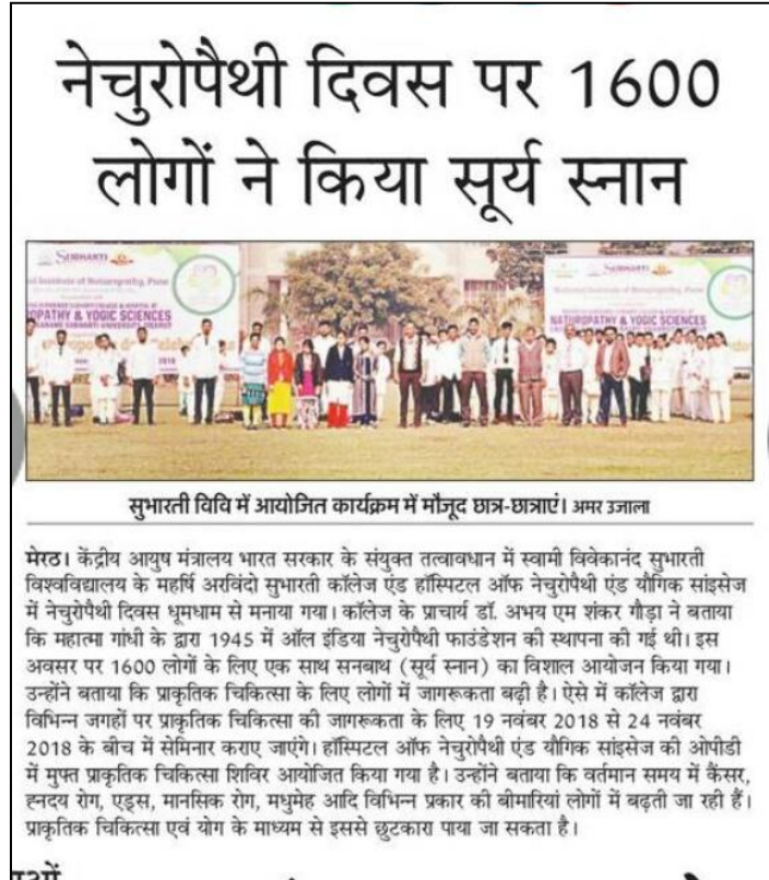
Article of Naturopathy day dated on 18 th November 2018 at Subharti University Meerut.