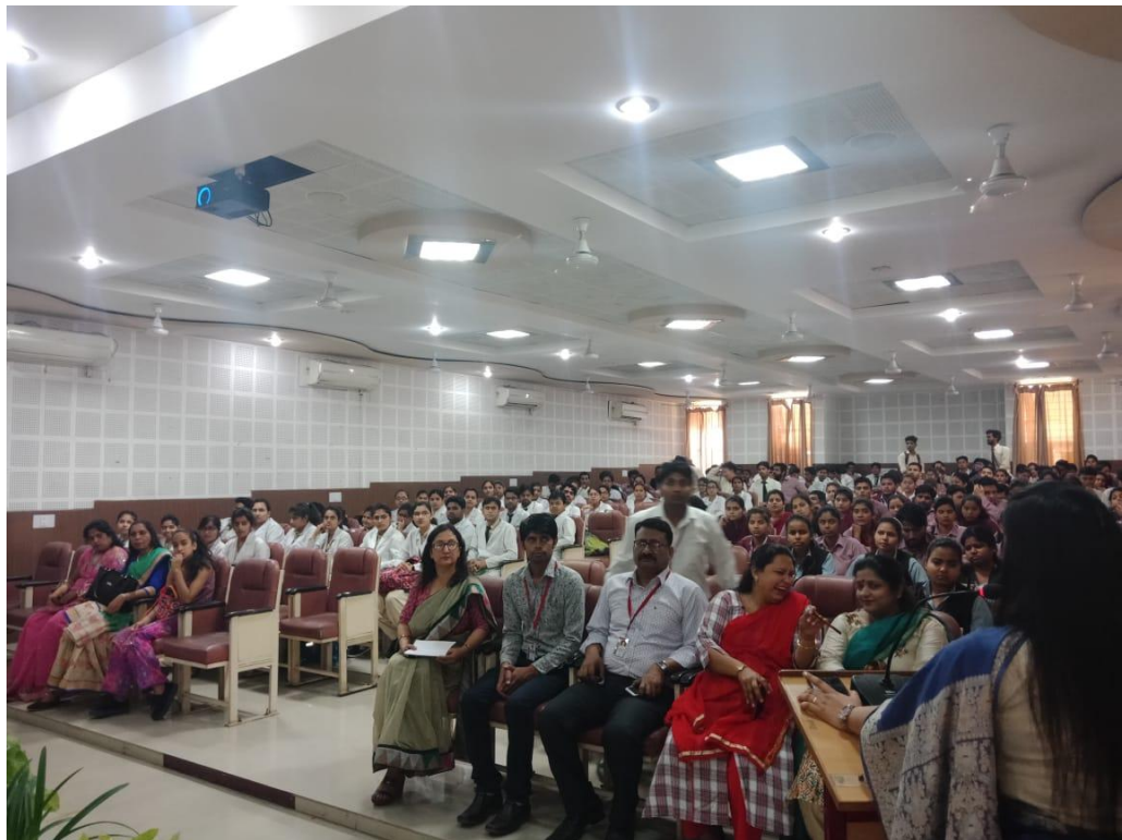
Our college NSS volunteers participated in Gender Sensitization workshop and Global “Mahasaddhanjotika Award Ceremony”