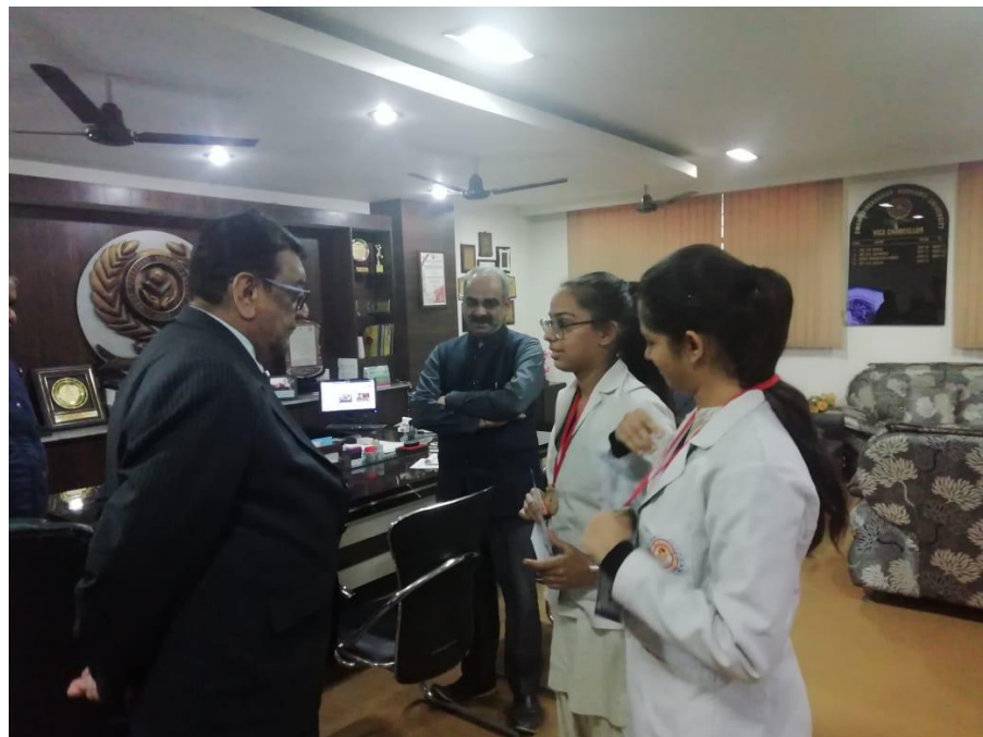
Our BNYS student participated in “All India Yoga Championship” Organized by Maharishi Patanjli yoga Sansthan (REGD.) The Hon'ble Vice Chancellor interacted & congratulated the students