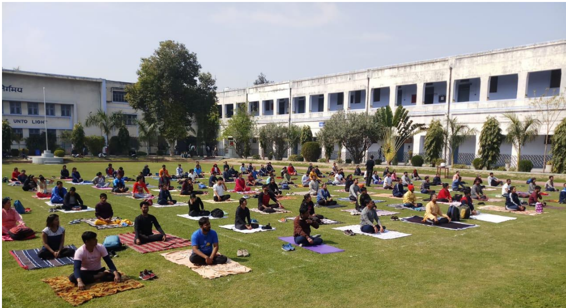
Yoga Workshop Regarding "Yoga for personality Development"