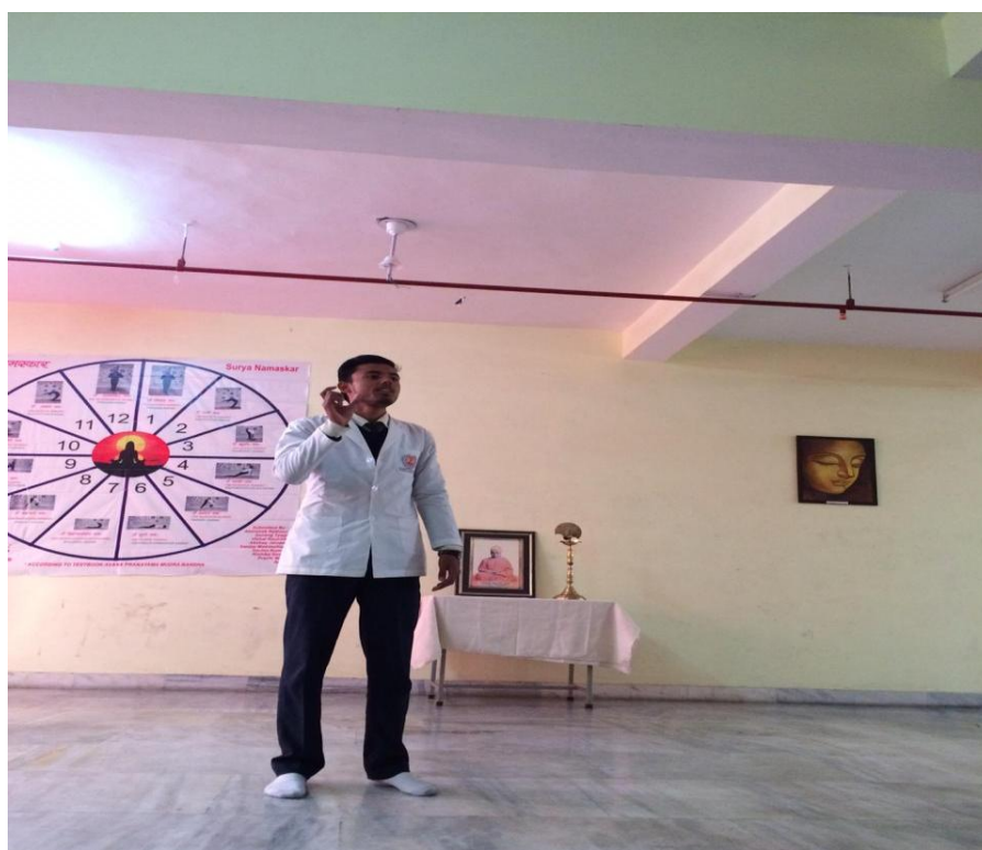
National Yuva Day – 2019 was celebrated in Maharishi Aurobindo Subharti College & Hospital of Naturopathy & Yogic Sciences