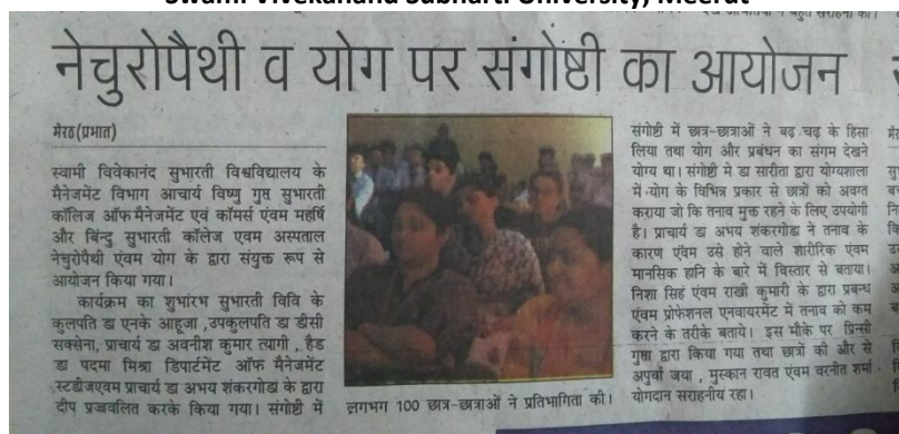
Article of Seminar in Hotel Management college at SVSU Meerut.