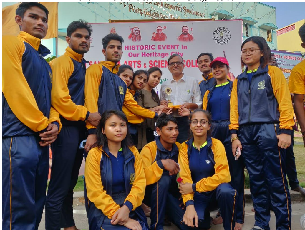
“All India Inter University Yoga Championship” hosted by University of Madras & Sri Sankara Arts & Science College in Enathur, Kanchipuram