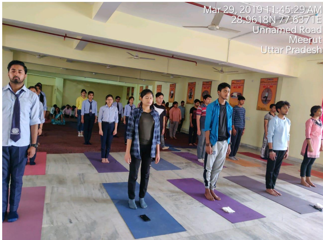
One day workshop on “Stress Management for Health and Happiness” was organized jointly by Department of Management Studies (DOMS) SITE, AVGSCMC & our college