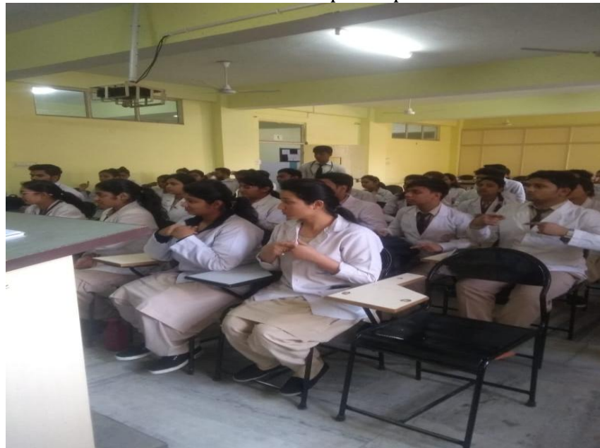
Hotel Management: Awareness Lecture on Importance of Yoga in Stress management