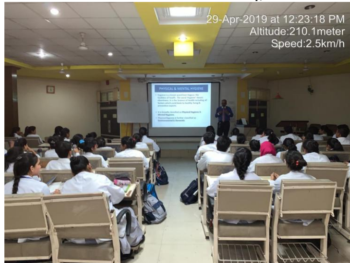
As part of the "Wellness Program" a Value added initiative for Health Promotion 'Health & Happiness in your hands' a lecture & demonstration on the Topic Physical & Mental Hygiene .