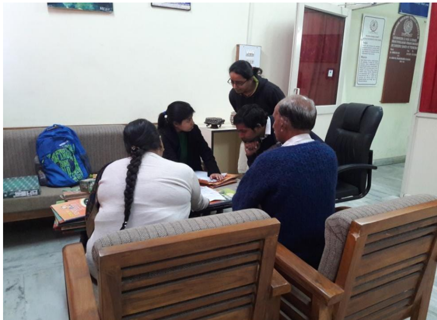
Our college conducted the Parents Teacher Meeting (P.T.M)