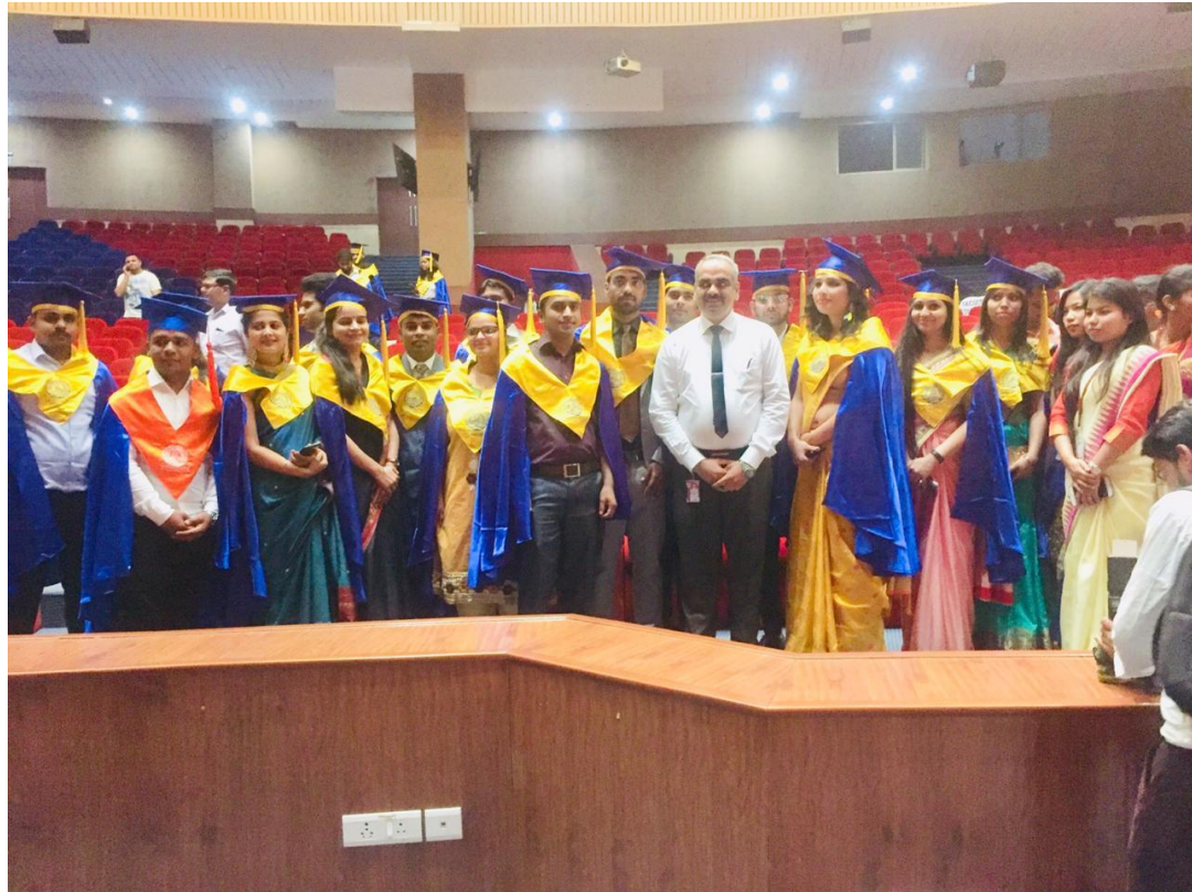
Convocation for the 3 rd batch (2013) who held on 27 th April, 2019 at Mangalya hall