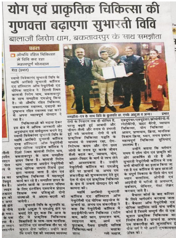
Article of A MoU was signed between Balaji Nirogdham, Bakhtawarpur a unit of Maharaja Agrasen Naturopathy & yoga Sadhana Research trust in Delhi and Swami Vivekanand Subharti University, Meerut on 05 th January 2019