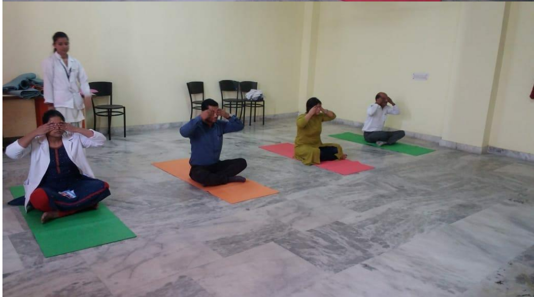
Yoga and Meditation session at 9am to 10am on the department of Psychiatry