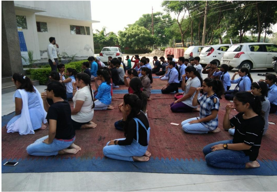
Two days Yoga Workshop in Orientation programme in Acharya Vishnu Gupt Subharti College of Management & Commerce