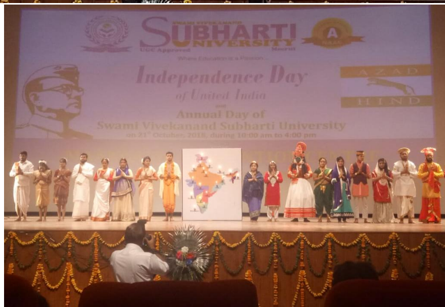
"Independence day of United India" & "Subharti Annual day" celebrated on 21 st October 2018