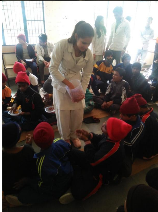
Sprouts Distribution: On the celebration of Naturopathy Day Preparation and Distribution of Sprouts