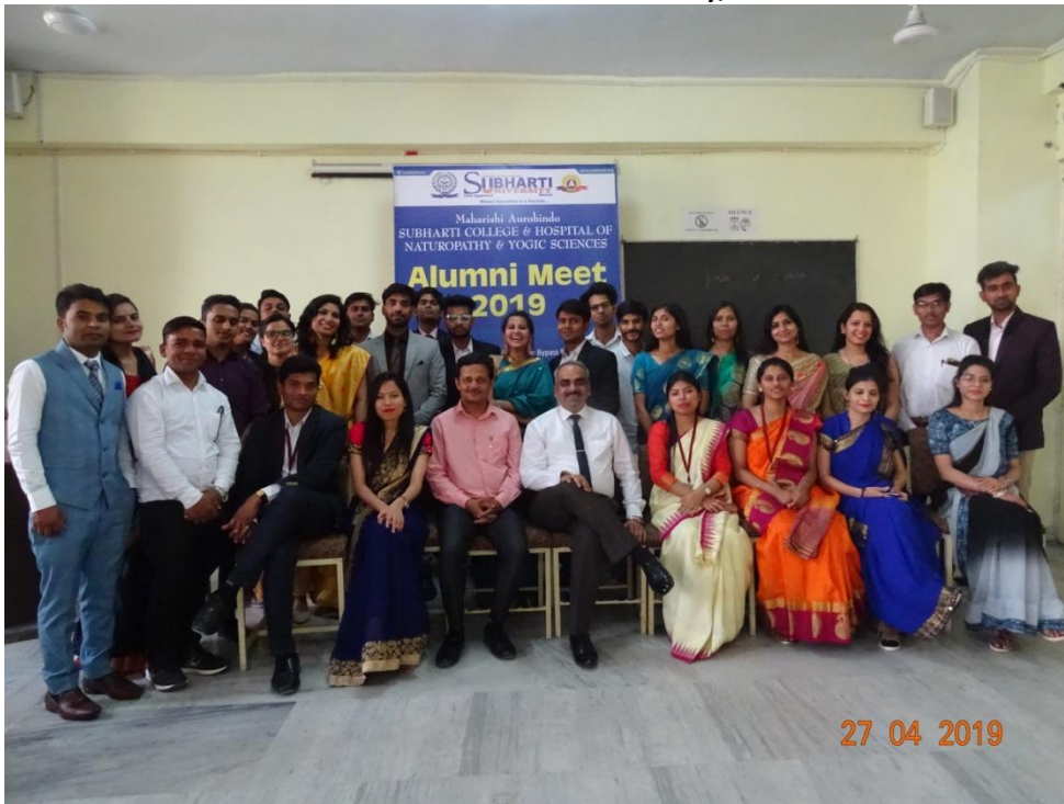
An Alumni Meet was held on 27th April 2019 in our college