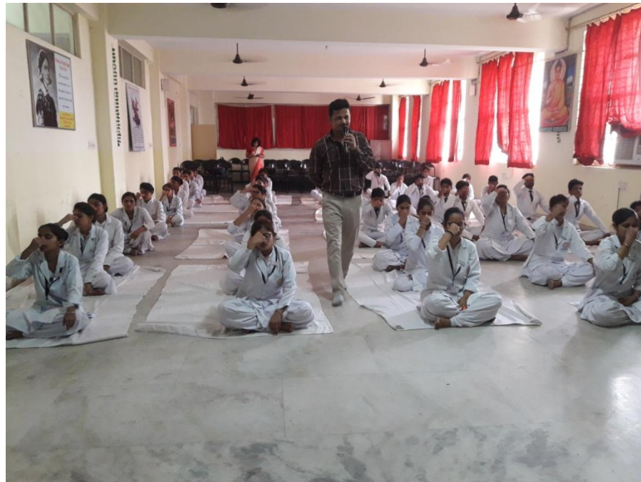
Our College Conducted a Yoga Workshop for 1st Year ANM Students & Teaching Faculty “On the event of “International Yoga Day “