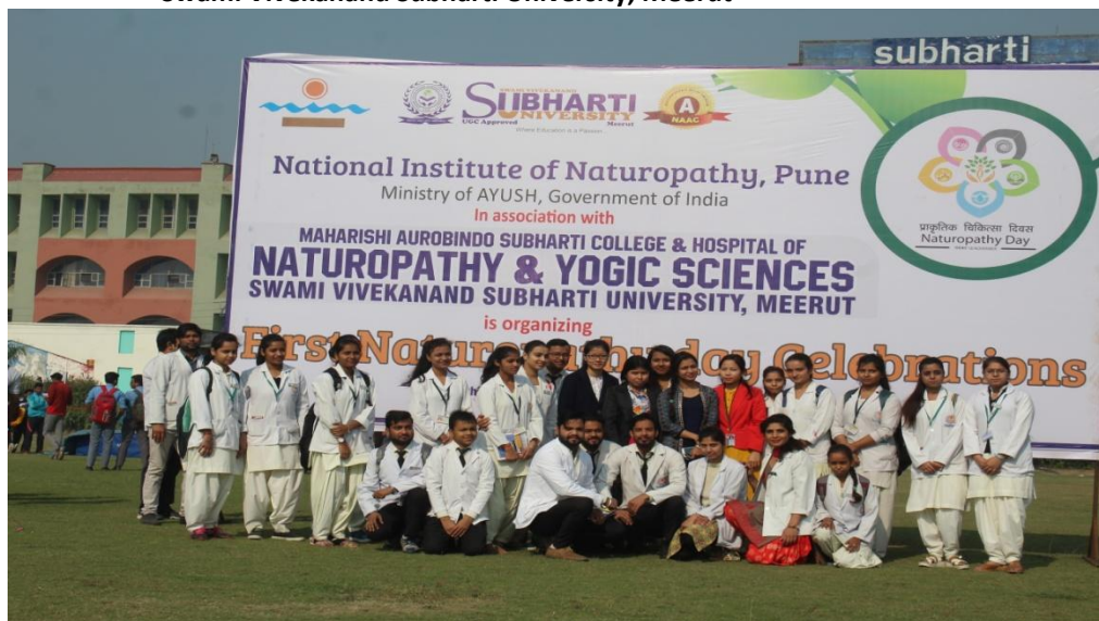
CME cum Workshop on "Interpreting Spirometry" to held at Subharti Medical College