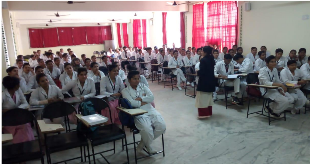
Paramedical Department: A lecture on Naturopathy and Yoga