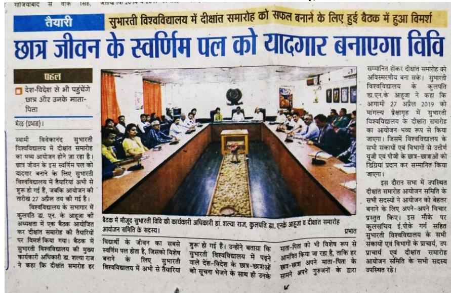
Article Meeting regarding Convocation at SVSU Meerut