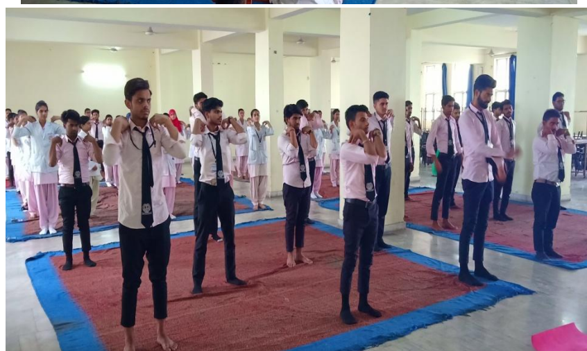
One day yoga workshop on the Occasion of “Inter National Nurses Work”