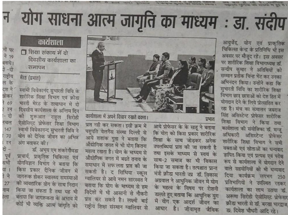
Article of two day workshop at SVSU Meerut.