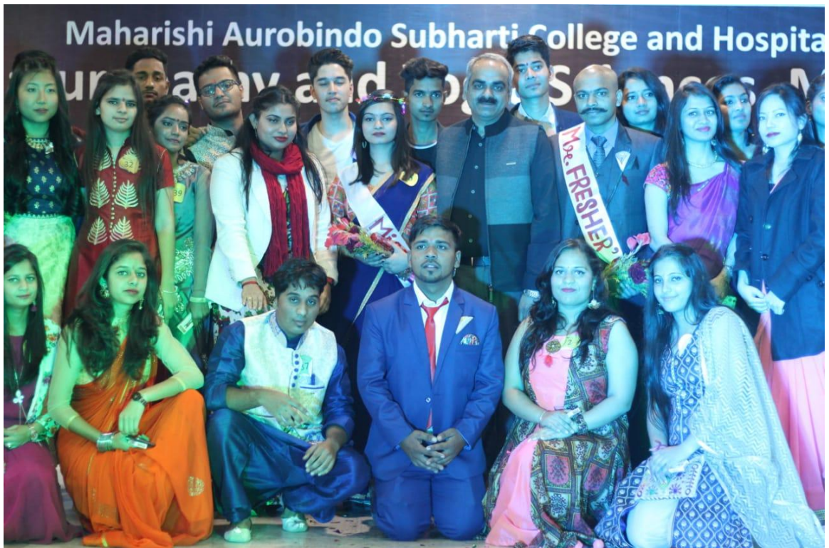
Our college organized fresher's day on 8 th December 2018 in GTB hall, Swami Vivekanand Subharti University